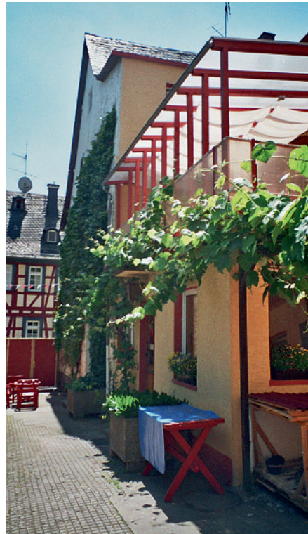
In diesem ehemaligen Hotel in Eltville bietet Vitos Rheingau fünf Plätze für Menschen mit Unterbringungsbeschluss an.

Zeit der Unterbringung sei für die Betroffenen immer auch eine Chance, wieder zu sich zu finden. Zunächst hätten sie Angst, verstünden nicht, was vor sich geht, und fühlten sich wie im Gefängnis. Im Laufe der Zeit würden sie jedoch klarer im Kopf und könnten wieder eigenständig denken. Laut Deutsche erkennen sie dann häufig auch, dass die Unterbringung notwendig war, da eine Nichteinweisung im schlimmsten Fall ihren Tod zur Folge gehabt hätte.