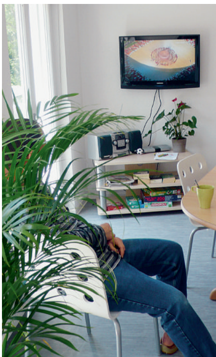
Dezentral und personenzentriert: Gemeinschaftsraum in der Einrichtung in Eltville.