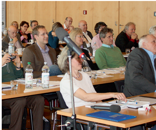
Mitgliederversammlung des PARITÄTISCHEN 2012. In diesem Jahr sind die Teilnehmer aufgerufen, nach der Sitzung bei einer Open-Space-Konferenz über die Zukunft sozialer Arbeit zu diskutieren.

Neben allen Mitgliedsorganisationen des PARITÄTISCHEN Hessen sind Expertinnen und Experten aus Politik und Verwaltung eingeladen. Ein mögliches Thema des Austauschs könnte die wachsende Finanznot der Kommunen sein, die Träger Sozialer Arbeit bereits in vielen Bereichen schmerzhaft spüren. Insbesondere Beschäftigungsträger kämpfen derzeit um ihre Existenz. Als Dachverband will der PARITÄTISCHE