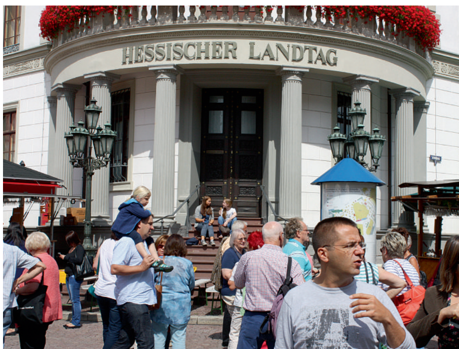
Egal wer künftig im Landtag regiert – Hessen muss sozialer und gerechter werden.

Der PARITÄTISCHE Hessen erwartet von der neu gewählten Landesregierung, dass sie konsequent gegen die Verarmung der Kommunen vorgeht. Nur mit einer grundlegenden Reform und Aufstockung des kommunalen Finanzausgleichs kann verhindert werden, dass die soziale Infrastruktur weiter ausgedünnt wird. „Schuldenbremse und Kommunaler Schutzschirm zwingen viele Kommunen zu massiven Sparmaßnahmen“, betont Günter Woltering. „Um diesen Abwärtstrend zu stoppen, muss auch auf Bundesebene