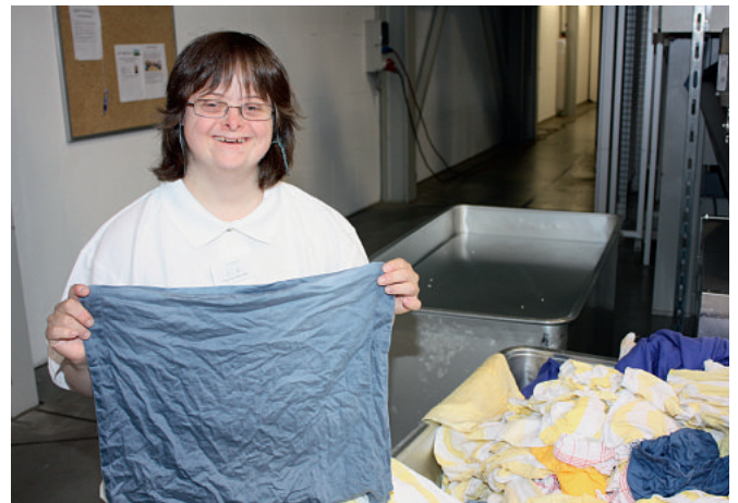
Die Heintzelmännchen Wäscheservice- und Hausdienstleistungsgesellschaft mbH ist ein Integrationsbetrieb des BWMK. Hier arbeiten Menschen mit und ohne Behinderung in den Bereichen Wäscherei und Schulverpflegung.

In unserer Gesellschaft sehen sich die Werkstätten für behinderte Menschen im gleichen Maße als Institutionen, wie sich Schulen und Kitas, Sportvereine und Hallenbäder, Universitäten und Bibliotheken, die Handwerkskammer und die Gewerkschaften, Krankenhäuser und die Rentenversicherung als In-