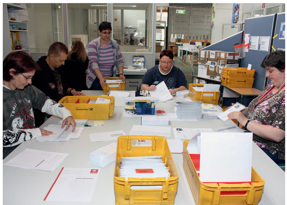
In der Reha-Werkstatt „Digitaldruckzentrum Alte Wäscherei“ des BWMK arbeiten Menschen mit psychischen Beeinträchtigungen in unterschiedlichen Dienstleistungsbereichen. Die Poststelle übernimmt beispielsweise das Management der gesamten Ausgangspost des bekannten Textilherstellers Engelbert-Strauss.

Für den Verein zur Förderung der Autonomie Behinderter – fab e.V. Uwe Frevert