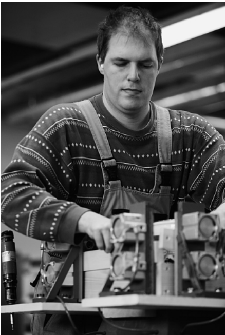
In den Bergwinkel-Werkstätten des BWMK in Schlüchtern stellen Menschen mit Behinderung hochwertiges Imkereizubehör her.

1961 wurden Gelder des Bundessozialhilfegesetzes kontinuierlich in steigendem Umfang zur Separation behinderter Menschen in Sondereinrichtungen missbraucht. Es geht um Sonderschulen, Sonderfahrdienste, die stationäre Unterbringung und die Mindestverwertbarkeit in Werkstätten für Behinderte. Es muss gesagt werden, dass es mit den staatlichen Geldern der Eingliederungshilfe allzu oft nicht um die Teilhabe behinderten Lebens in der Gesellschaft geht.