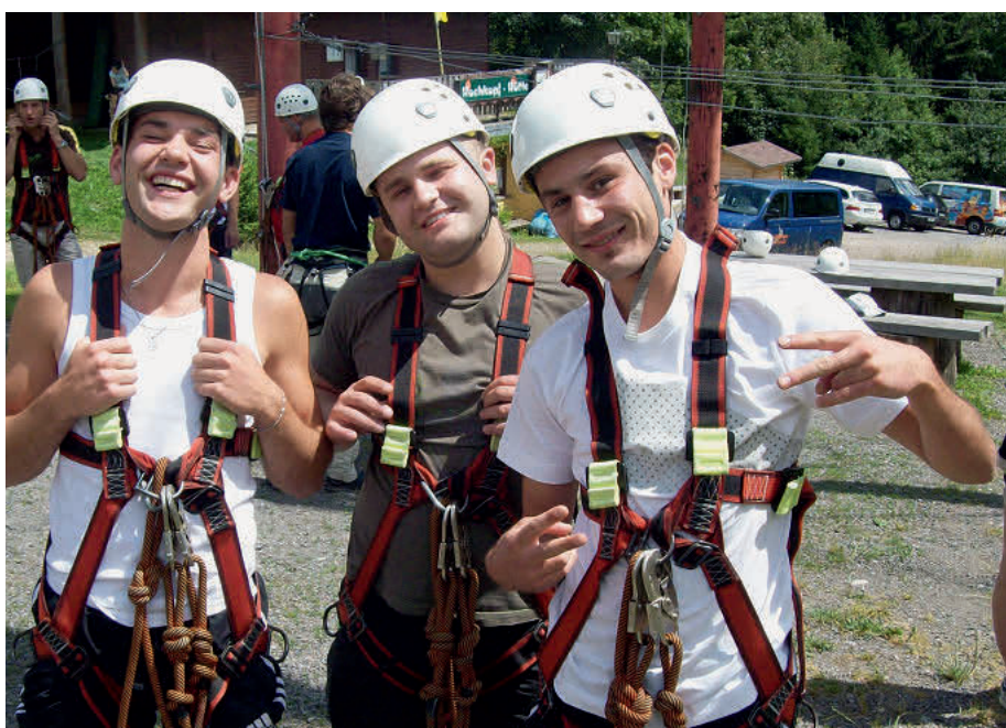
Fertig zum Klettern. Mit jungen Männern russlanddeutscher Herkunft startete pro familia ein Projekt zur aufsuchenden Beratung.