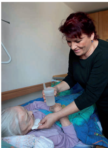
Interkulturelle Kompetenz ist auch in der Pflege wichtig.

„warum Menschen im Glauben verhaftet sind“. Mit der zusätzlichen Kompetenz als Kulturmittlerin will sie später als ehrenamtliche Pflegebegleiterin pflegende Angehörige unterstützen.