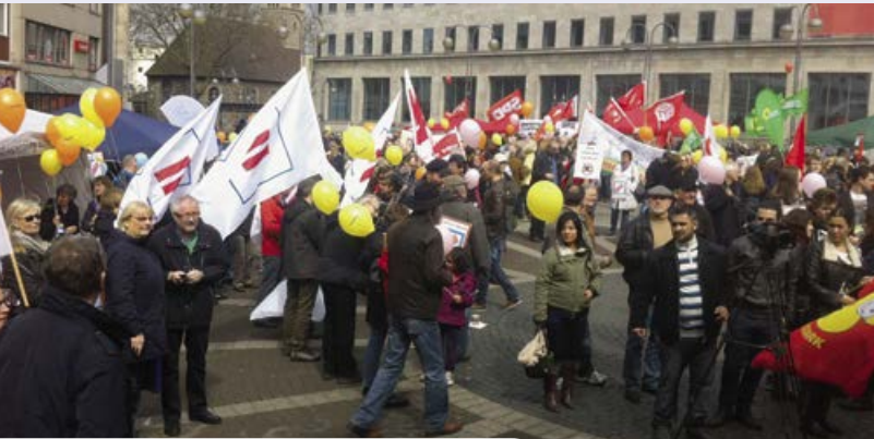
Unterschriften sammeln in Hannover