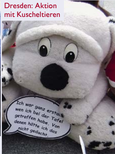
Dresden: Aktion mit Kuschtelieren