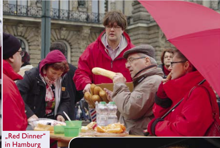
„Red Dinner“ in Hamburg