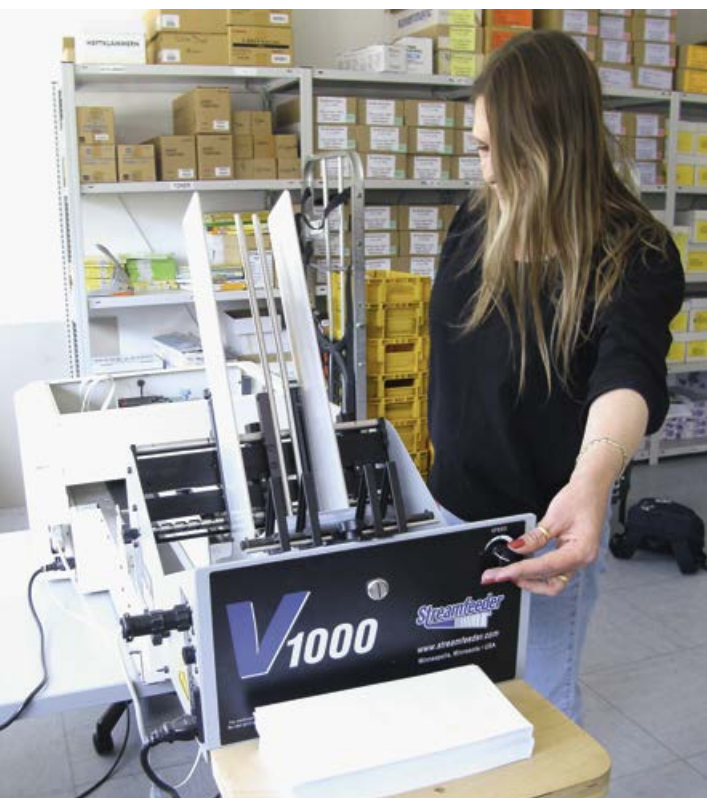
Viele zufriedene Kunden: Das Team im Lettershop leistet hervorragende Arbeit.