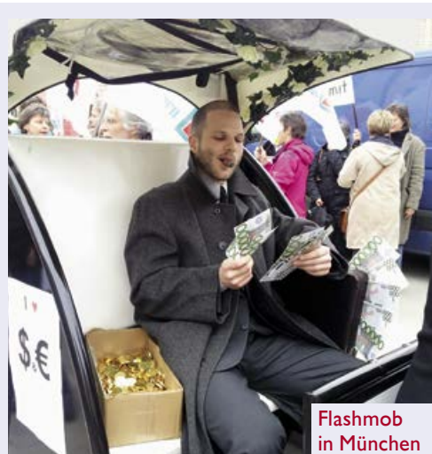
Flashmob in München