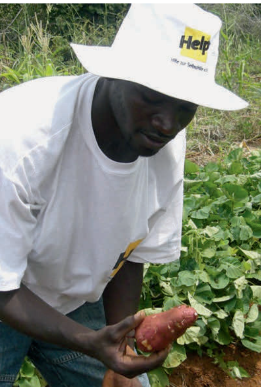
Süßkartoffel-Anbau in Simbabwe

Eine Schale Hirse pro Tag. Sie macht nicht satt, aber sie verhindert, dass ein Mensch verhungert. Als 2005 die Hungersnot in der Sahelzone am größten war, verteilte auch Help Hirsesäcke, um die Menschen mit Mindestrationen zu versorgen. Im vorigen Jahr konnte eine weitere Hungersnot abgewendet werden, weil Help und andere Organisationen rechtzeitig reagierten: So unterstützte der Verein Help in Burkina Faso 4.200 Haushalte mit Hirserationen, die er zu subventionierten Preisen verkaufte und an mittellose Menschen kostenlos verteilte. Der Erlös dient den Dorfgemeinschaften nun als Rücklage für künftige Krisen.