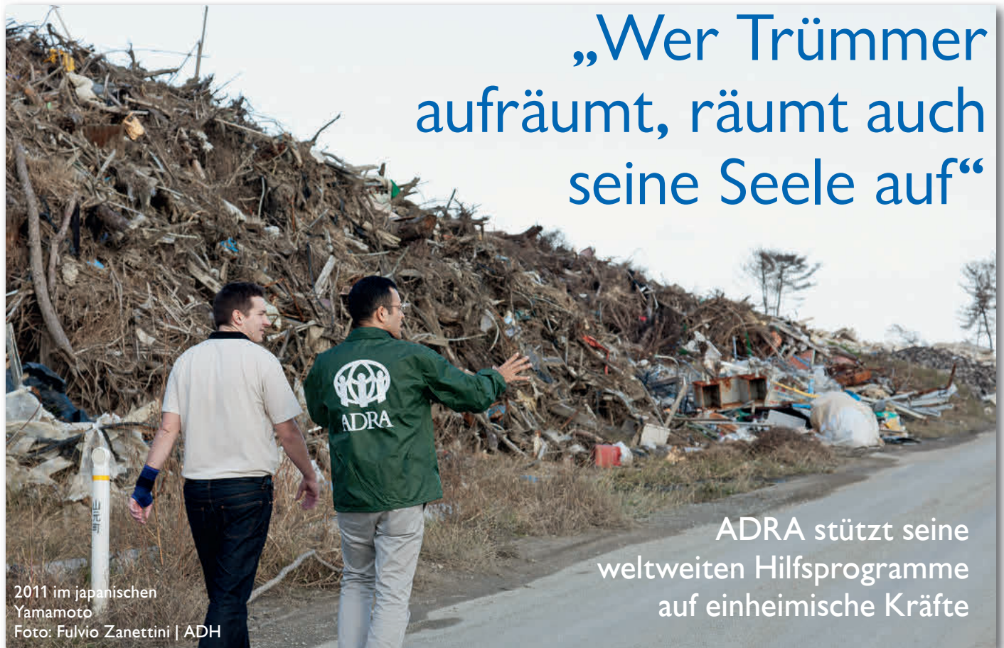
2011 im japanischen Yamamoto