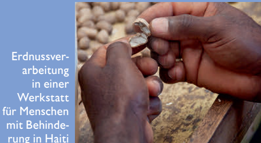
Erdnussverarbeitung in einer Werkstatt für Menschen mit Behinderung in Haiti