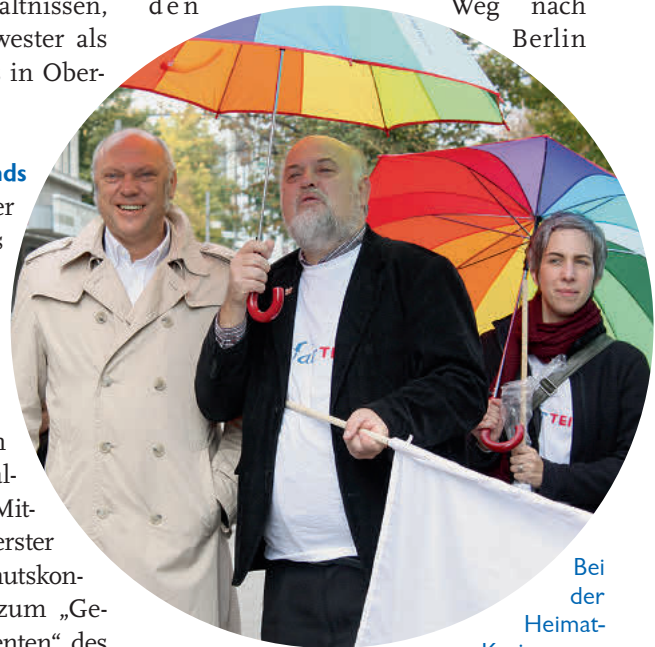
Bei der Heimat-Kreisgruppe Oberhausen

weiß, das Herz, die Seele hängt am Haus der Parität in Frankfurt.“ Doch behutsam gelingt es ihm, alle mit auf den Weg nach Berlin