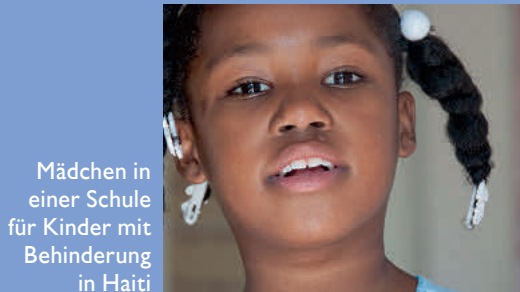
Mädchen in einer Schule für Kinder mit Behinderung in Haiti

Gerne hätte der Verein auch sein landwirtschaftliches Projekt in Eritrea ausgeweitet. Dort wurden Mikrodämme aus Steinen errichtet, um durch konstantes Versickern von Regenwasser ganzjährig den Zugang zu sauberem Trinkwasser und die Bewässerung von Feldern zu sichern. Nur: Die Projektarbeit im Land wurde von der dortigen Regierung gestoppt, alle Aktivitäten von Nichtregierungsorganisationen sind bis auf Weiteres unter-