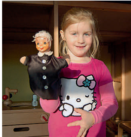
Darf ich vorstellen: Das ist Herr Kneipp!

„Vergesst mir die Seele nicht!“ Mit diesem Satz hat die Kita ihr Konzept überschrieben. Für seelisches Gleichgewicht sorgt nach Kneipp die Lebensordnung. So ist das Leben in der Villa Kunterbunt voller Rituale und Regel-