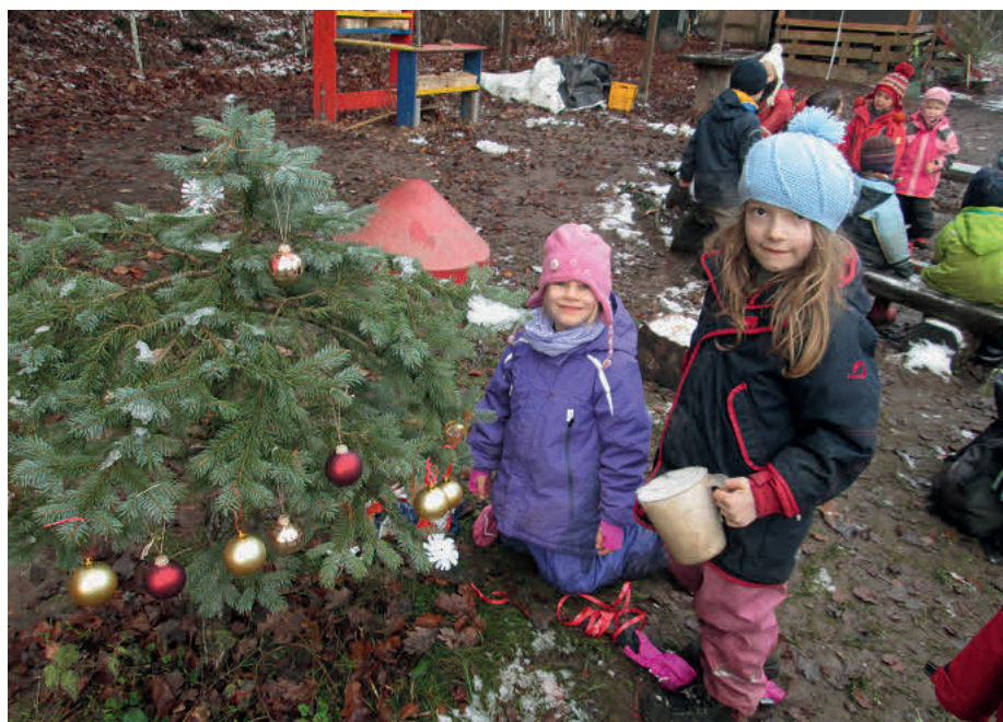
Natürlich gibt es im Wald auch einen geschmückten Christbaum.