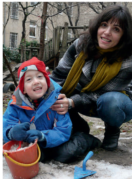
Die Individualität der Kinder steht stets im Mittelpunkt.