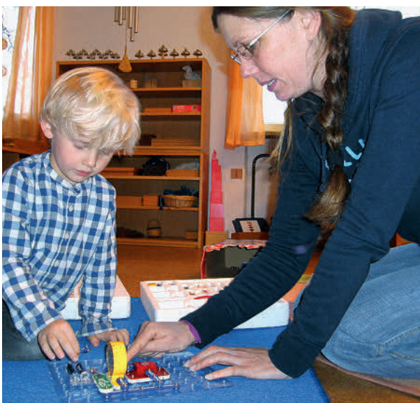
Erzieherinnen helfen nur, wo nötig.

* Die Namen der Kinder wurden von der Redaktion geändert