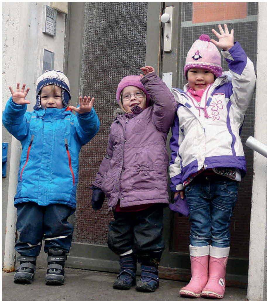
Herzlich willkommen im Kinderhaus Friedenau. Das gilt für Kinder aller Nationalitäten, mit und ohne Behinderung.

Unter unserem Dach ist Platz für jedes Kind: So lautete die Losung, die am Anfang stand. Angeleitet von einem Arzt, fand 1972 die damals bundesweit einzigartige Initiative von Eltern zu- sammen. Bis heute führen sie den Trä- gerverein des Kinderhauses. Alle woll- ten ihre Kinder gemeinsam erziehen lassen – ganz gleich, wie gut oder schlecht sie sprechen oder laufen konnten, wie offensichtlich oder ver-