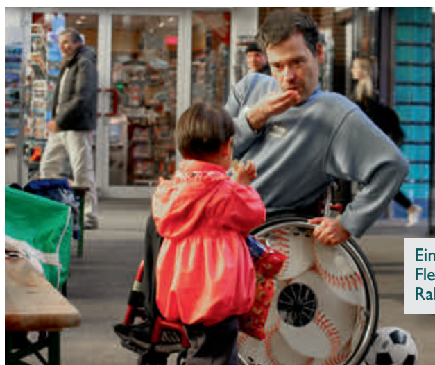
Einer von vielen ehrenamtlichen Helferinnen und Helfern am Flensburger Bahnhof. Auch für sie gibt es nun Angebote im Rahmen des neuen AMIF-Projekts.