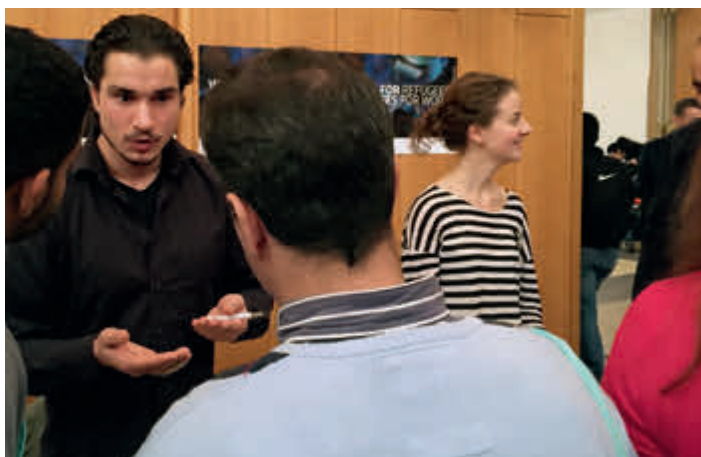
Mitarbeiter des Projekts „Jobs for Refugees“ bei einer Jobbörse im Gespräch mit Flüchtlingen

Integration in den Arbeitsmarkt – so könnte man die ersten Erfahrungen des Projekts zusammenfassen – ist Schwerarbeit auch für die Vermittler