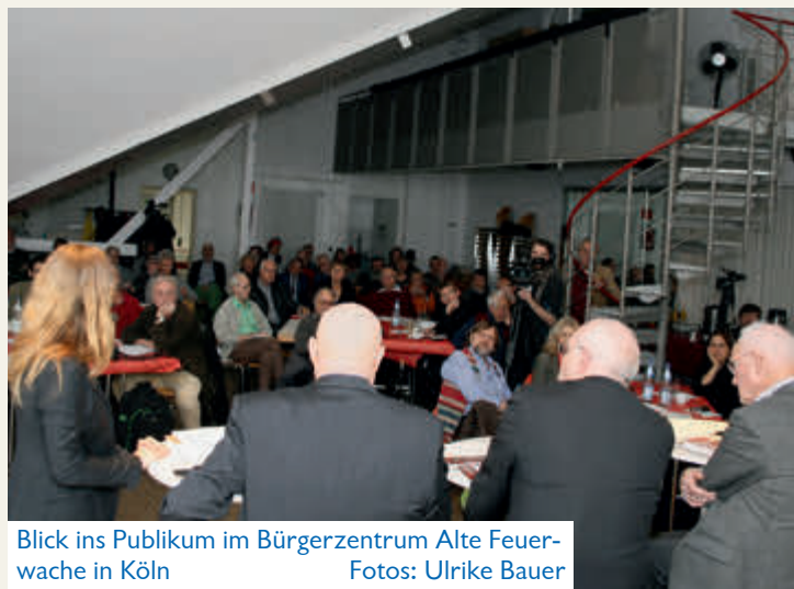
Blick ins Publikum im Bürgerzentrum Alte Feuerwache in Köln