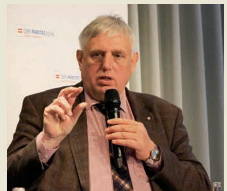
Staatssekretär Karl-Josef Laumann