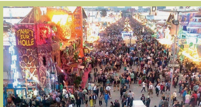
Rund sechs Millionen Menschen aus aller Welt besuchen jährlich das Münchner Oktoberfest

Rund 200 Besucherinnen suchen jährlich während der 16 Wiesntage Hilfe und Unterstützung am sogenannten Security Point, unserer Anlaufstelle direkt auf dem Festgelände. Die Problemlagen sind vielfältig, und wir versuchen bei allen Anliegen zu helfen: Eine 16-jährige Münchnerin, deren Handyakku leer ist und die ihre Freunde nicht erreichen kann. Eine australische Touristin, die im Gedränge ihren Mann verloren hat und die Hoteladresse nicht weiß. Eine junge Soldatin aus den USA, deren Kriegstraumatisierung wieder aufbricht. Eine Düsseldorferin, deren betrunkenen Freund sie verprügelt hat. Eine Auszubildende, deren Chef sie bei einer Firmenfeier auf der Wiesn bedrängt und sexuell genötigt hat. Eine Holländerin, die auf dem Heimweg von zwei Männern ins Gebüsch gezogen und begrapscht wurde. Eine Studentin aus Florenz, die auf der Toilette vergewaltigt wurde.