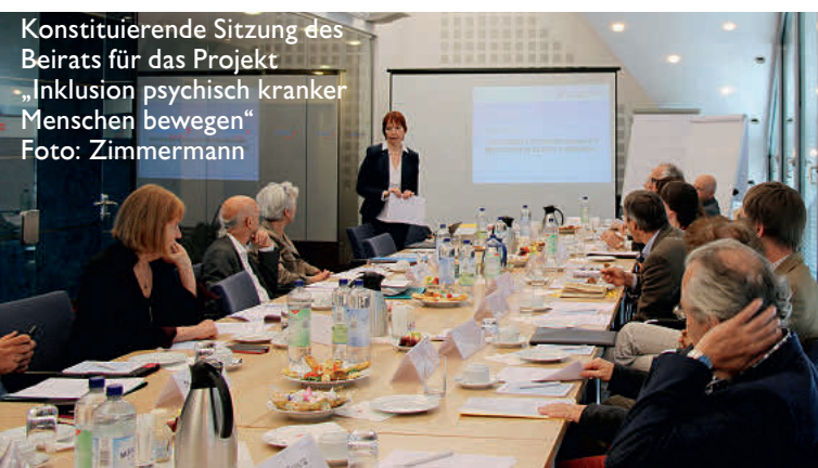
Konstituierende Sitzung des Beirats für das Projekt „Inklusion psychisch kranker Menschen bewegen“

Projekt „Inklusion psychisch kranker Menschen bewegen“ Sabine Bösing, Tel.: 030/24636-453 inklusion@paritaet.org