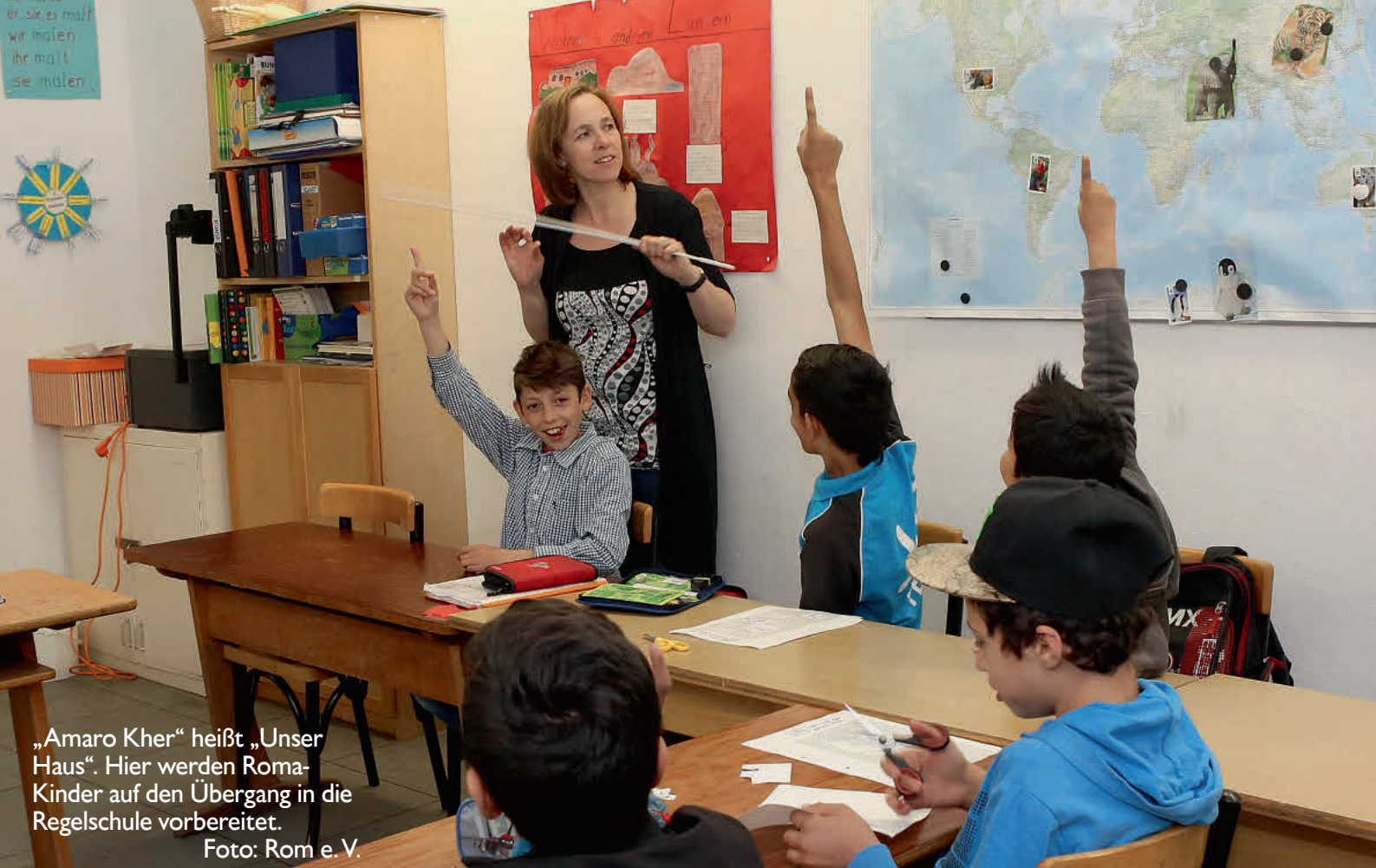
„Amaro Kher“ heißt „Unser Haus“. Hier werden Roma-Kinder auf den Übergang in die Regelschule vorbereitet.